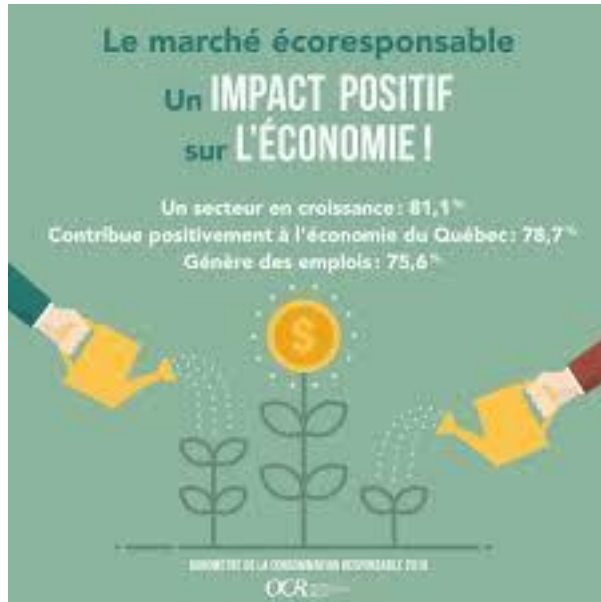
Baromètre de la consommation responsable

Upointeinc Environnement Ces scientifiques qui veulent sauver la planète par Geoffrey Dirat 4 novembre 2028